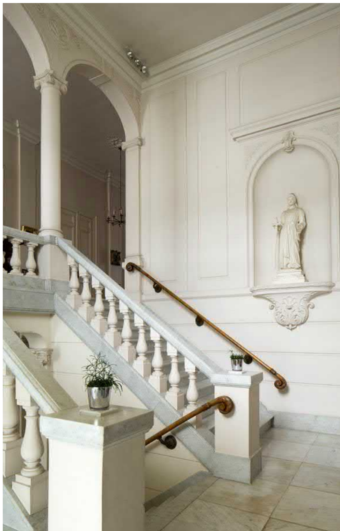
De traphal in de gouverneursresidentie.