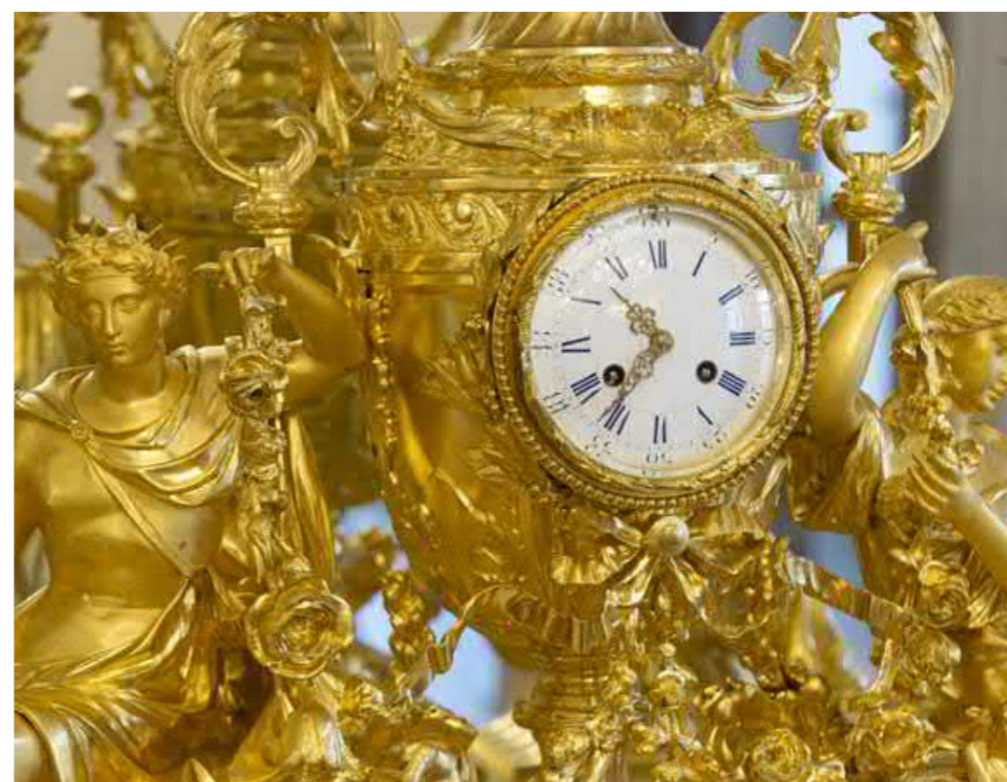
De gouverneursresidentie in Brugge.