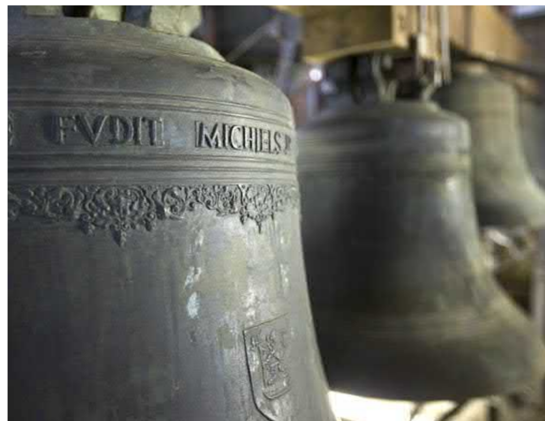
De beiaardier en enkele klokken van het Brugse belfort.