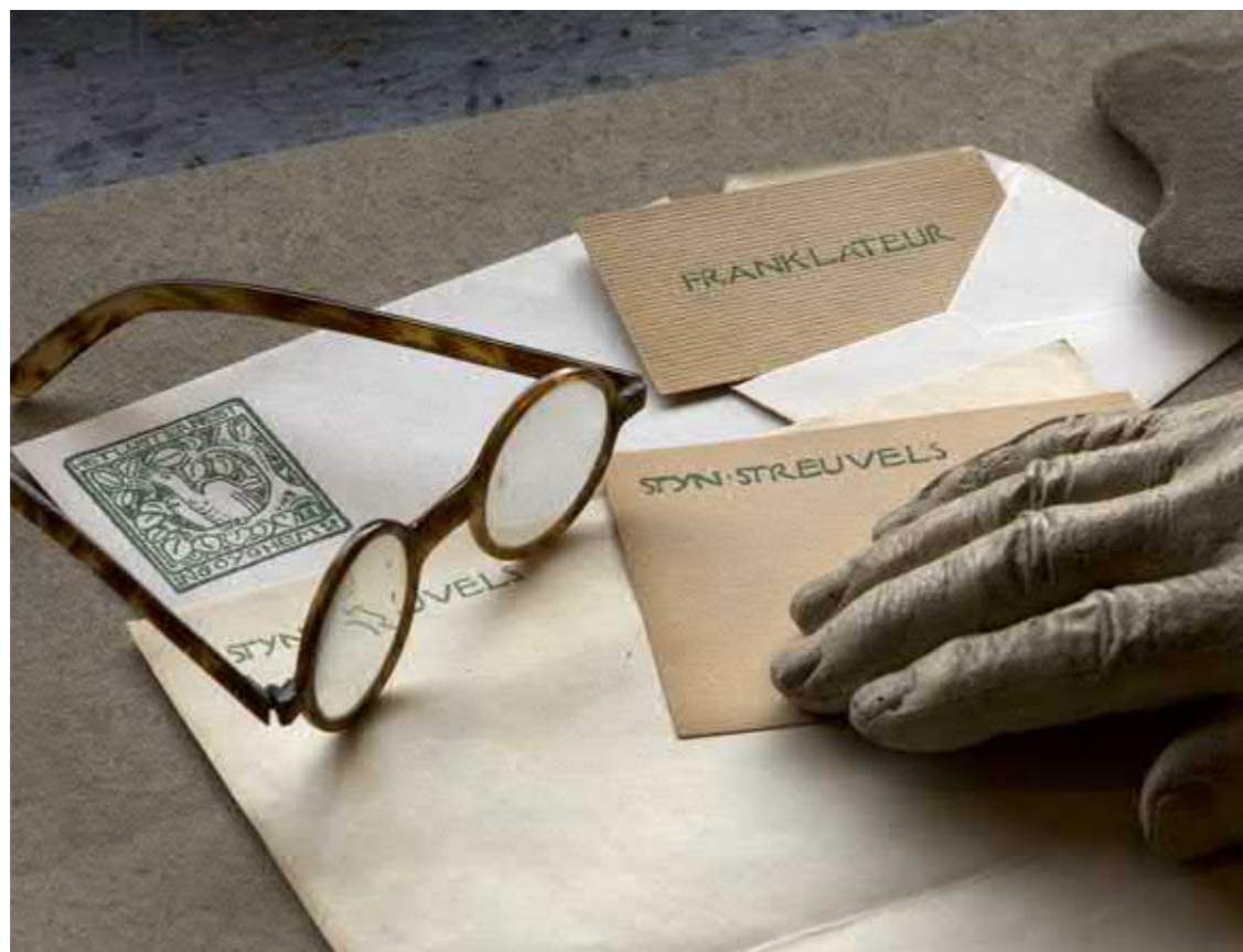
De bijkeuken van het Lijsternest in Ingooigem.