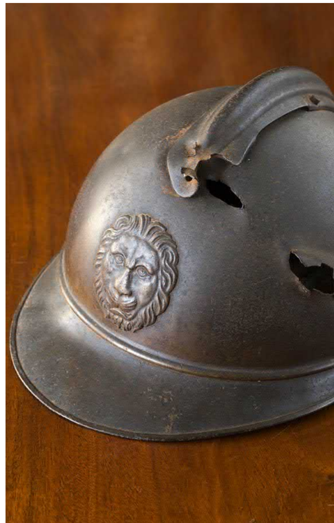
De helm van Léon Martel die bewaard wordt in Westlandrica, Provinciale Erfgoedbibliotheek.

Zarren Couchemolen: 2002(1), 2003(3), 2004(1), 2006(3) Wullepitmolen: 1995(E), 1996(2), 1998(3), 1999(2), 1999 (3), 2000(1) Zedelgem Platsemolen: 1996(2) Vloethemveld: 1996(2) Zeeuws-Vlaanderen: 2002(2) Zerkegem: 2007(2) Zillebeke Domein Palingbeek: 1999(2) Zwevegem: 2013(2)