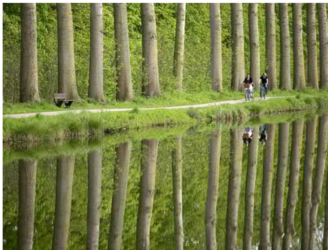
Oorlogslandschap in het Provinciedomein De Palingbeek. Het kanaal Ieper-Komen.