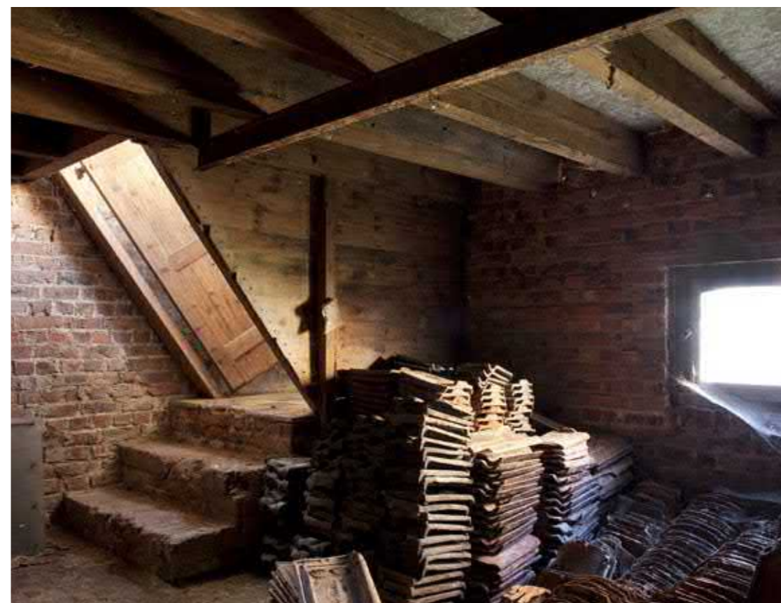
De site D'Hondt in Menen.