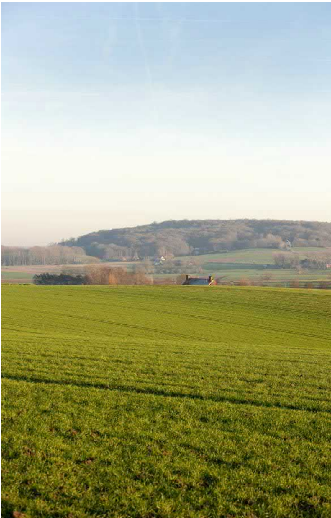
Het landschap rond de Kemmelberg.