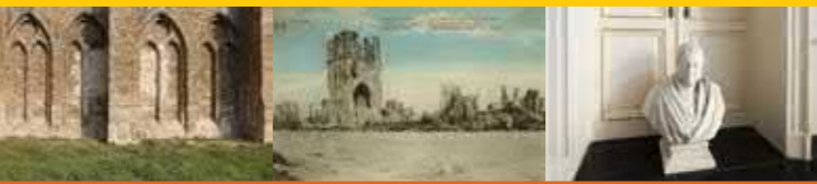
Erfgoednieuws uit West-Vlaanderen drieëntwintigste jaargang 2017 - nr. 2