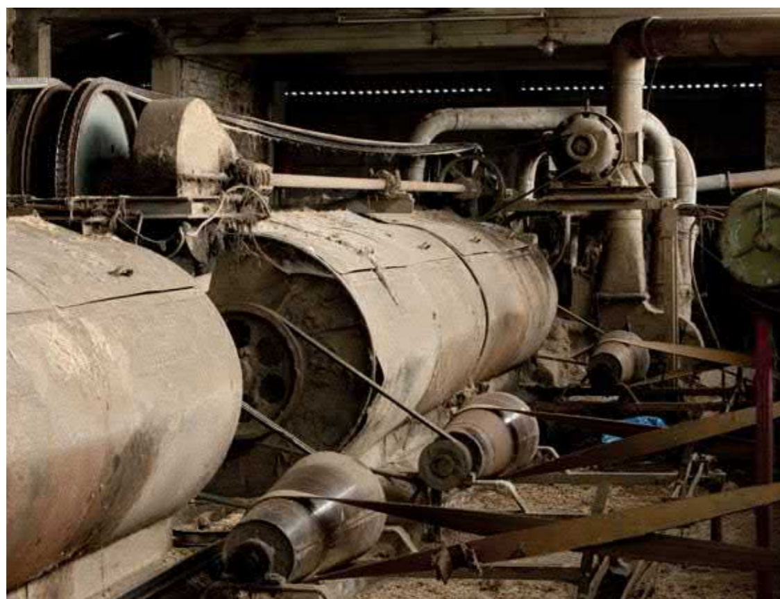
Het viasbedrijf Mommerency in Ingelmunster.